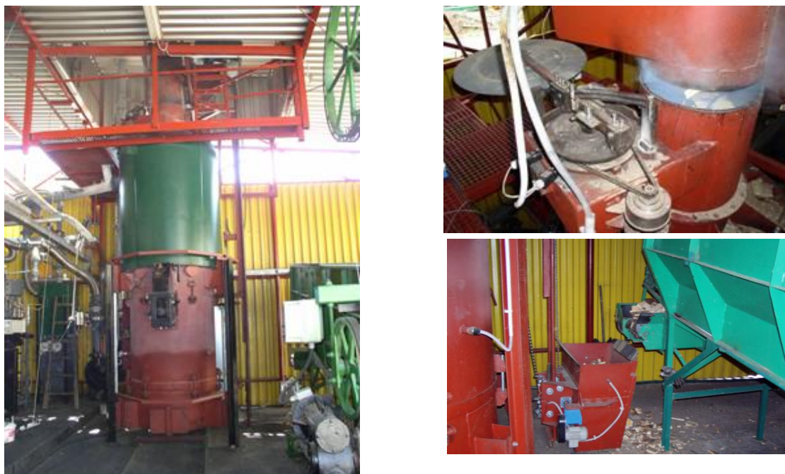
Obr. 1 Celkový pohled na generátor, detailní pohled na uzavírací klapku a mobilní palivový vozík

V České republice je několik společností, nebo akademických institucí, které se s větším či menším úspěchem snaží o uvedení do provozu konkurenceschopné kogenerační jednotky založené na zplyňování biomasy. Některé technické a technologické prvky tyto jednotky mají společné, v některých se zase dosti výrazně liší. Zdrojem plynu v obou případech je souprůdý generátor typu Imbert, který byl podroben modifikacím, zaměřeným především na zlepšení a stabilizaci kvality plynu a také na zvýšení účinnosti celého procesu a již byly blíže popsány [2,4]. Některé instituce se pokoušejí i o vlastní konstrukce zplyňovacích generátorů [3]. Ve všech případech je zplyňovacím médiem vzduch a jako palivo je využíváno buď kusové dřevo, nebo dřevný odpad například ve formě štěrky, nicméně tento způsobuje v klasických generátorech typu Imbert provozní problémy. Ve většině případů je vidět snaha o maximální implementaci automatizace klíčových procesů a pokročilých systémů řízení provozu komplexních jednotek.