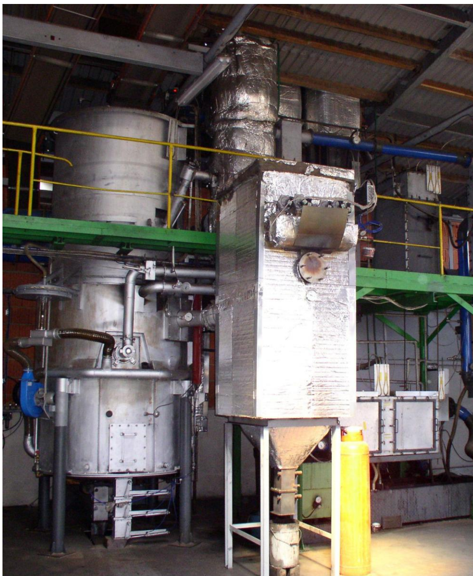
Obr. 2 Zplyňovací generátor a horký filtr společnosti TARPO s.r.o. umístěný v obci Kněžves u Rakovníka

Zařízení společnosti BOSS Engineering (Obr. 1) umístěné v obci Louka bylo včetně provedených modifikací podrobně popsáno již v předchozích příspěvcích [2,4,5]. Zdrojem plynu v kogeneračním zařízení společnosti TARPO s.r.o. (Obr. 2) je upravený generátor typu Imbert, jehož hlavní modifikace jsou zaměřeny především na rekuperaci tepla a vyšší účinnost termochemické konverze biomasy na plynné palivo.